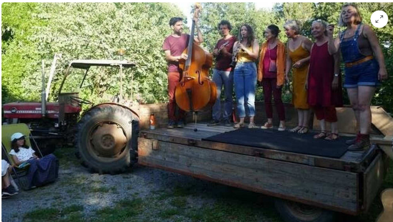
Le collectif ensemble tout contre, dans un extrait de leur spectacle « L'hiver sera chaud ».

Les Sorties de four, organisé par le collectif Théâtre, musique, solidarité, ambition et fougue (TMSAF), ont commencé la tournée itinérante, lundi 21 août 2023 au village de Brimenel, au Tiercent (Ille-et-Vilaine), en utilisant un tracteur comme moyen de locomotion et proposer une animation autour du four.