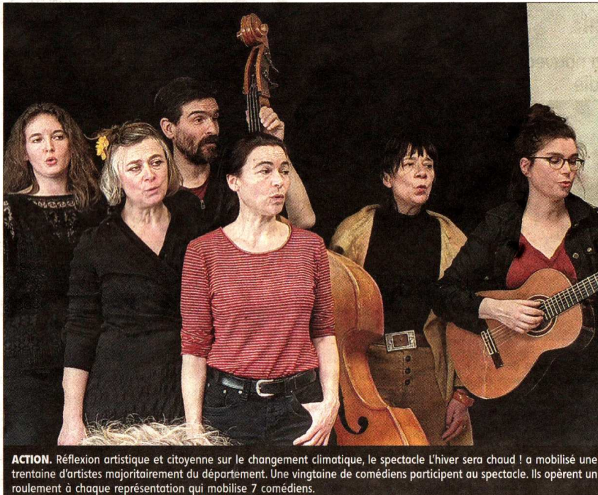
ACTION. Réflexion artistique et citoyenne sur le changement climatique, le spectacle L'hiver sera chaud ! a mobilisé une trentaine d'artistes majoritairement du département. Une vingtaine de comédiens participent au spectacle. Ils opèrent un roulement à chaque représentation qui mobilise 7 comédiens.

Un spectacle accessible à tous avec des moments pendant lesquels le public est invité à inter-