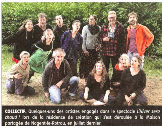
COLLECTIF. Quelques-uns des artistes engagés dans le spectacle L'hiver sera chaud ! lors de la résidence de création qui s'est déroulée à la Maison partagée de Nogent-le-Rotrou, en juillet dernier.