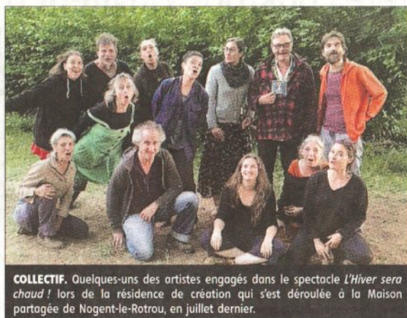
COLLECTIF. Quelques-uns des artistes engagés dans le spectacle L'hiver sera chaud ! lors de la résidence de création qui s'est déroulée à la Maison partagée de Nogent-le-Rotrou, en juillet dernier.

En cours de création, le spectacle L'hiver sera chaud ! est constitué de scènes puisées dans la BD d'Emma (Massot éditions) « Un autre regard sur le climat », mais aussi de textes qui abordent le sujet : rapport du GIEC, Convention citoyenne pour le climat, prises de paroles de Greta Thunberg, livres de Michel Serres, etc. « Ce sera un spectacle positif, il ne s'agit pas d'accabler les gens sur la catastrophe qui arrive, nous voulons plutôt donner la pêche aux gens, leur donner envie de se mobiliser pour changer le cours des choses. Il y aura beaucoup de chansons, de l'énergie, de l'humour », prévient Mathieu